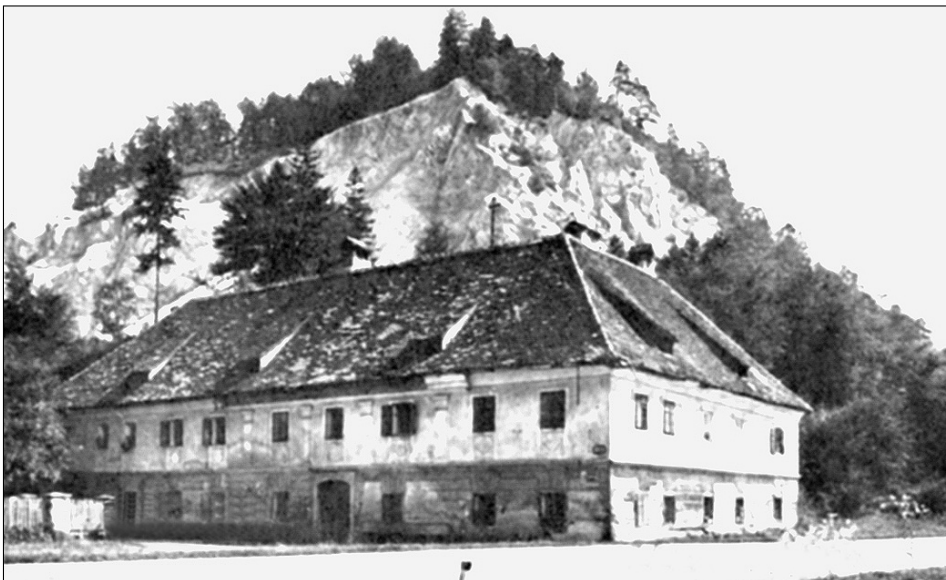
Fotografija stare podpeške mitnice in pošte iz druge polovice 20. stoletja

* Ferdo GESTRIN, 1991: Slovenske dežele in zgodnji kapitalizem . Ljubljana: Slovenska matica.