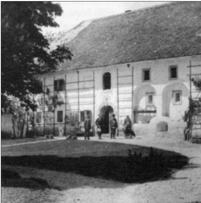
Fotografija breške hiše iz leta 1932