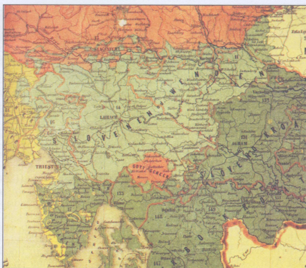
Narodnostno ozemlje Slovencev (po nemško imenovani tudi Wenden) na etnografski karti Avstro-Ogrske iz leta 1856 (K. Czoernig: Ethnographische Karte der österreichischen Monarchie), iz kartografske zbirke NUK. Zemljevid je razstavljen tudi v posloplju evropskega parlamenta EU v Strasbourgu.

Če v 1. svetovni vojni ne bi zmagale sile antante (v katero je bila vključena tudi Kraljevina Srbija), bi lahko Slovenci pozabili še na tiste pravice, ki so jih imeli v Kraljevini SHS. Kraljevine SHS (kasneje preimenovali v Kraljevino Jugoslavijo) zaradi izgube slovenske Primorske in centralističnih težnj srbske politike ne moremo imeti za politično tvorbo, ki bi v celoti uresničila narodne in politične interese Slovencev leta 1918. Po drugi strani pa se moramo tudi zavedati, da so se proti koncu njenega kratkega obstoja začele resne priprave za večjo samostojnost Slovencev v okviru predlagane ustanovitve banovine Slovenije. Eden izmed pomembnih vzrokov za osamosvojitvene težnje Slovencev v okviru Kraljevine Jugoslavije je bila ustanovitev banovine Hrvaške (ki je geografsko ločila Slovence od preostalega dela kraljevine) s sedežem v Zagrebu, ki je dobila zelo velike