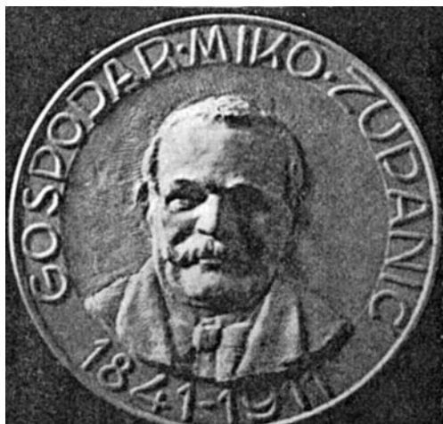
Slika 1: Miko Zupanič (1841–1911), relief kiparja A. Repiča.