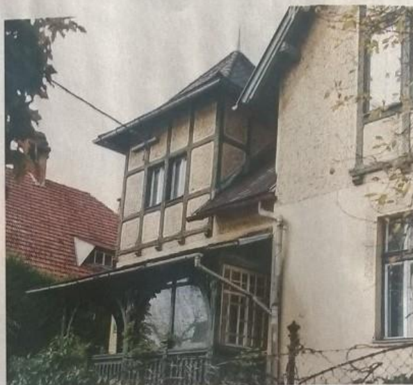
Vila na Jamovi 6, prav tako izpraznjena in najverjetneje predvidena za rušenje

► posnemovalcem ter občudovalcem v središču Ljubljane, saj kaj podobnega ni mogoče več videti v nobeni od postkomunističnih držav, ki so vključene v EU, kjer so tovrstne spomenike umaknili, na primer v posebne tematske parke z zbirkami spomenikov komunističnih voditeljev. In pa kako to, da imamo v Ljubljani spomenik za Srbe sicer zelo pomembnega Vuka Karadžića (čigar spomeniku v Ljubljani ne nasprotujem), nimamo pa hkrati tudi spomenika njegovega mentorja Jerneja Kopitarja. Situacija, primerna za kakšno prestolnico kolonije, ne pa za prestolnico samostojne Republike Slovenije.